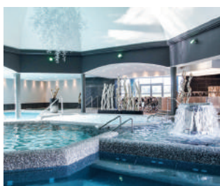
RENNES SAINT-GRÉGOIRE www.aquatonic.fr/rennes