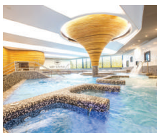
NANTES CARRÉ LAFAYETTE www.aquatonic.fr/nantes