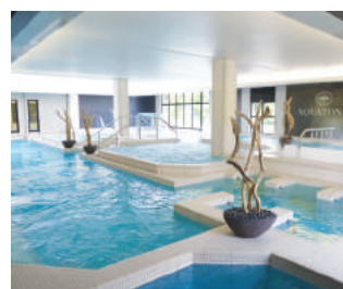
PARIS VAL D'EUROPE www.aquatonic.fr/paris