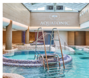
LES THERMES MARINS DE SAINT-MALO www.aquatonic.fr/saint-malo